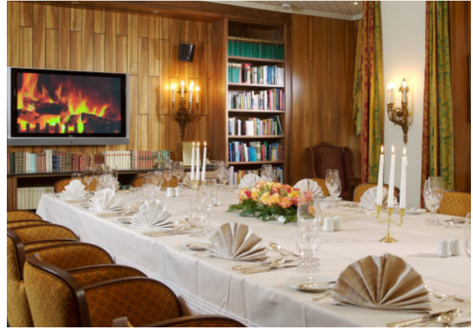
Bibliothek 45 m 2