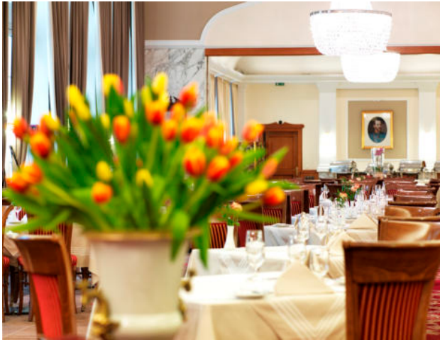
Festsaal 235 m 2 - in 3 Teile unterteilbar