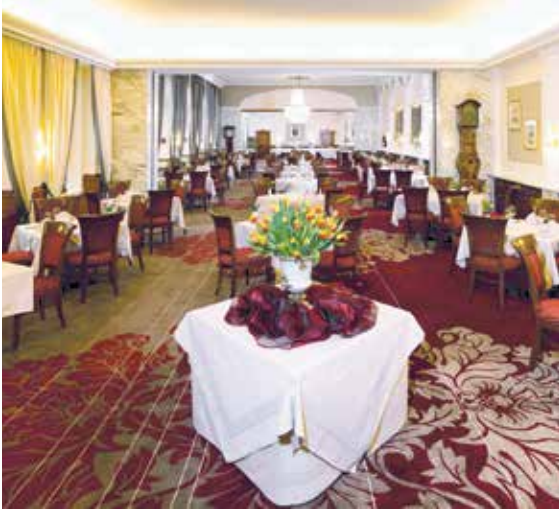
Festsaal 235 m 2 - in 3 Teile unterteilbar