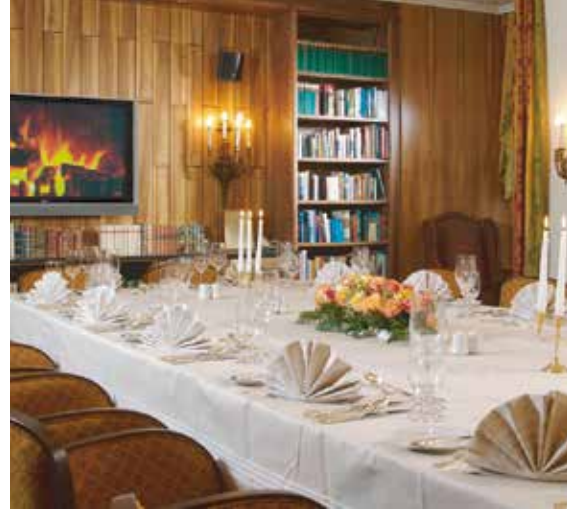
Bibliothek 45 m 2