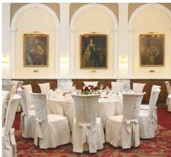
Festsaal 235 m 2 - in 3 Teile unterteilbar